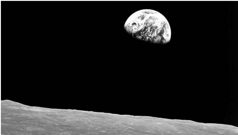
Abb. 1: Das Bild "Earthrise" gilt als Symbol der Umweltbewegung.

Und noch mehr ist in den fast sechs Jahrzehnten meiner persönlichen Lebensspanne passiert. Am Heiligabend 1968 machte der NASA-Astronaut William Anders vom Raumschiff der Apollo-8-Mission ein Foto, das unter dem Namen „Earthrise“ vom Time Magazine wegen seiner Bedeutung für den Umweltschutz in die Liste der 100 einflussreichsten Fotografien aller Zeiten aufgenommen wurde. Jeder wird dieses Bild bereits einmal gesehen haben, und im April 2020, mitten in der ersten COVID-19-Welle, jährte sich der erste „Earth Day“, dessen Entstehung eng mit diesem Bild verknüpft ist, zum fünfzigsten Mal.